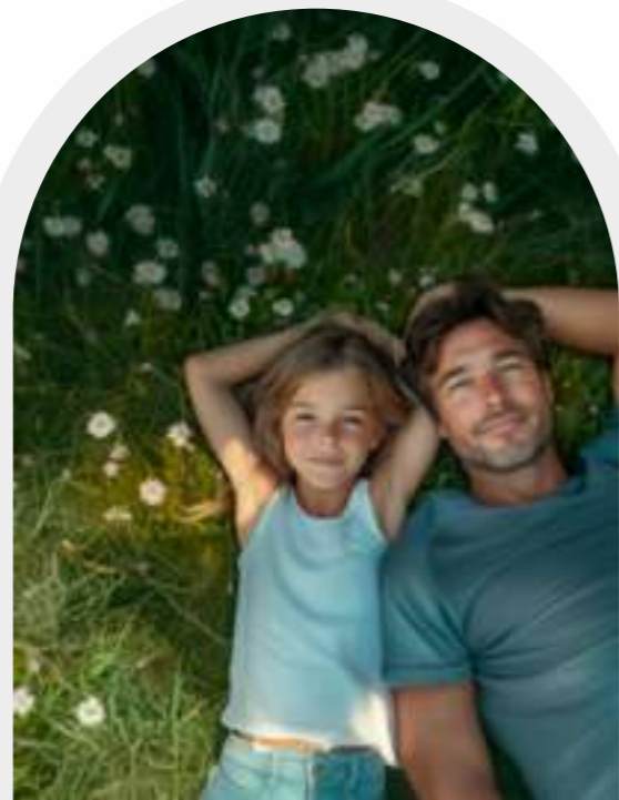
2 | Naturaleza urbana