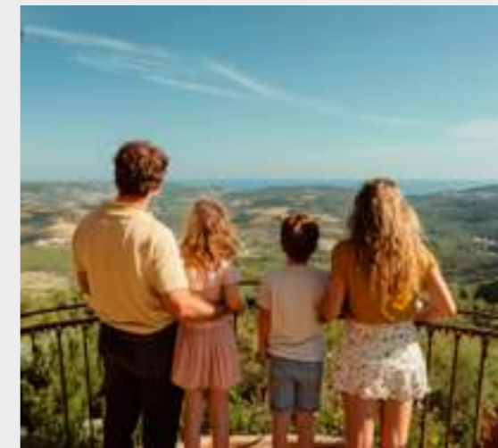
11 | Riqueza visual