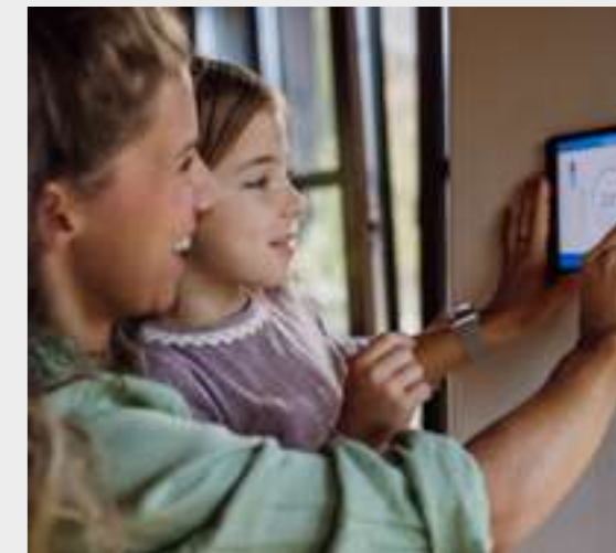
9 | Innovación y tecnología