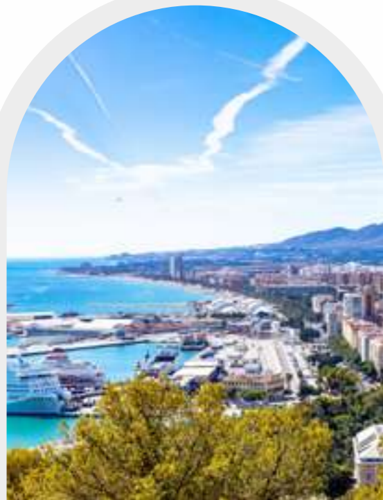
1 | Entorno exclusivo