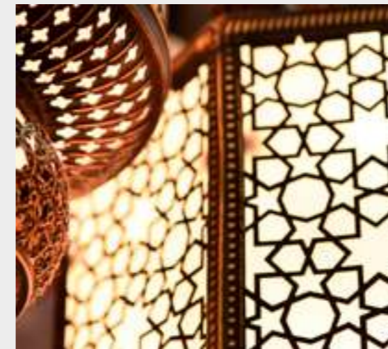
10 | Regreso a nuestros orígenes