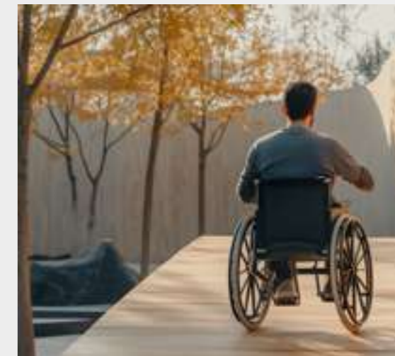
12 | Pensando en el ciudadano