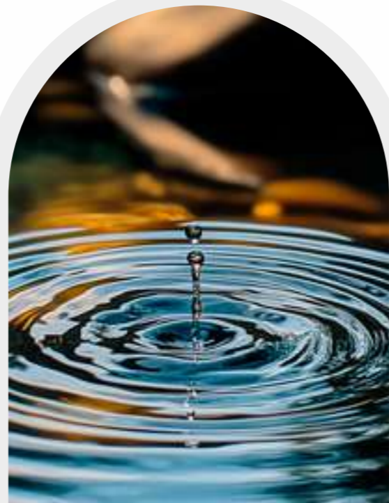
3 | Sostenibilidad medioambiental