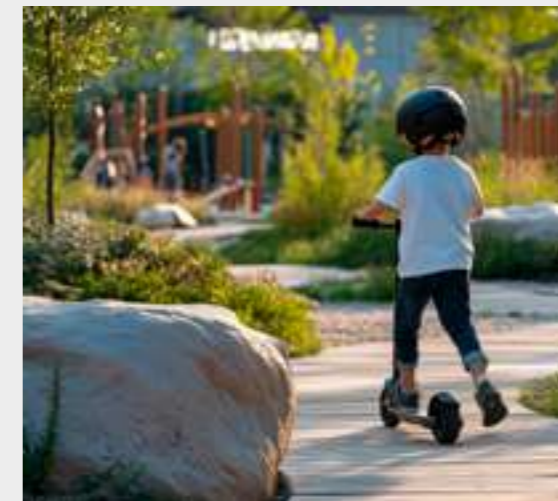
8 | Zona de juegos infantiles