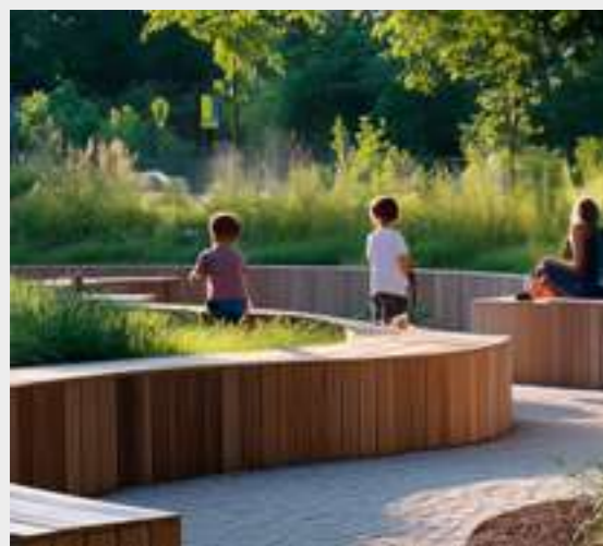
4 | Sostenibilidad social