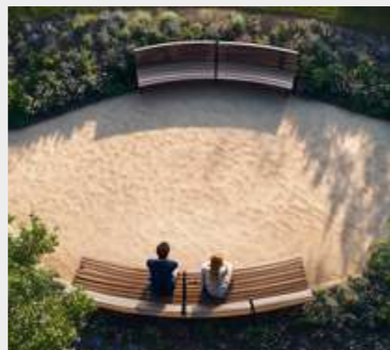
6 | Espacios públicos singulares