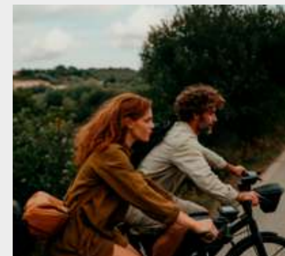
15 | Vida activa y saludable