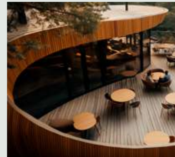
7 | Espacios multigeneracionales