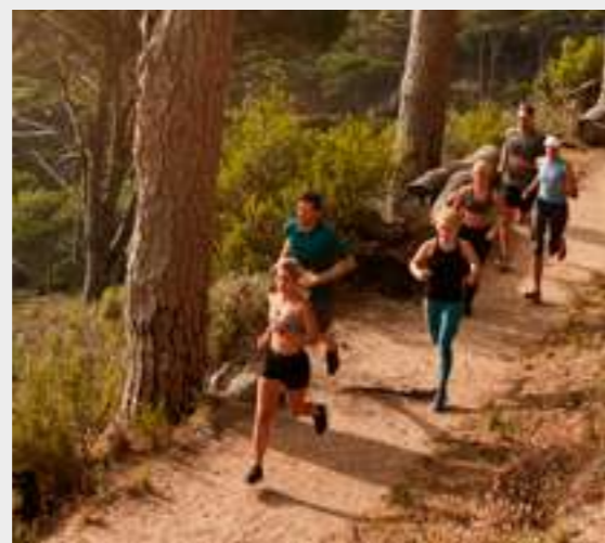
5 | Sendas naturales